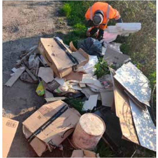
Enlèvement d'un dépôt sauvage chemin du Buisson Gayet

Poursuite des travaux de la future salle des fêtes avec la pose de la charpente