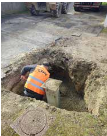
Réparation d'un affaissement ruelle des Bois et rue des Ruelles par l'entreprise TPE