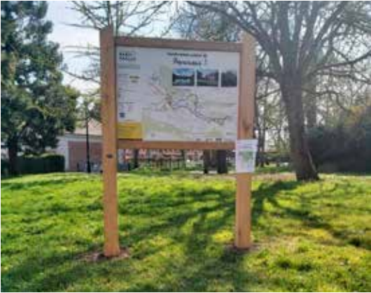
Pose d'un panneau de la carte de randonnée « Marcoussis, au fil de la Salmouille »