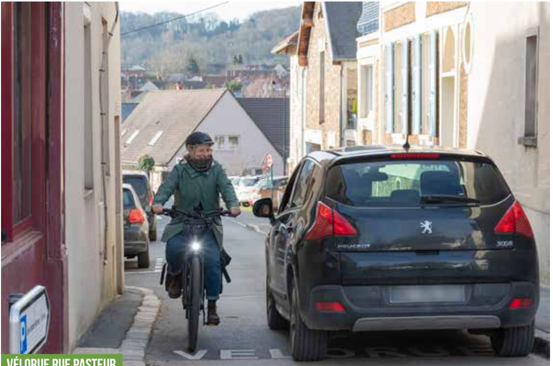
VÉLORUE RUE PASTEUR