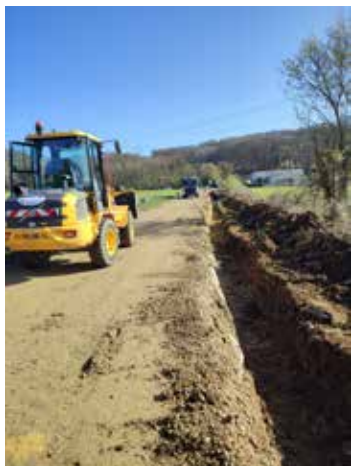
Chemin de la Ronce à Bel Ébat en cours de réalisation