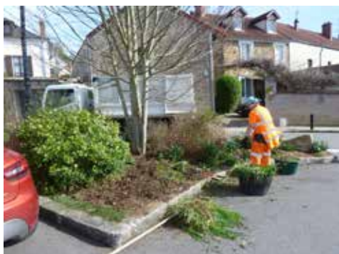
Désherbage place de la République