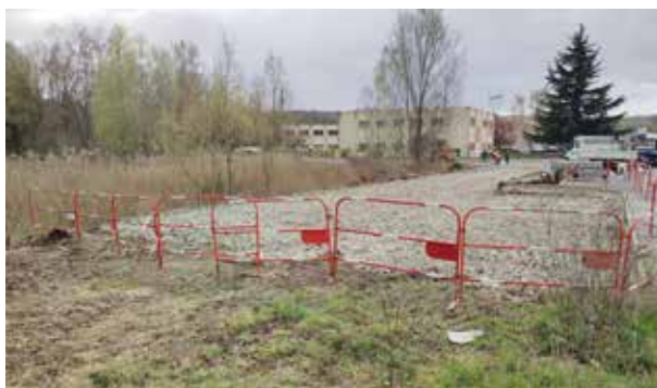
Création du parking du tiers-lieu « Le Chêne-Rond »