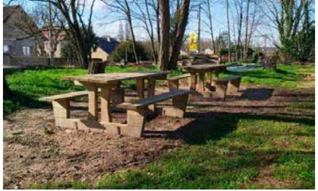
Pose de tables à pique-nique au Service Jeunesse