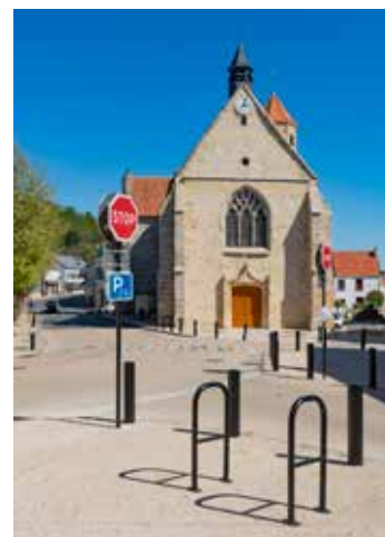
Création de parkings à vélo place de la République et place du Souvenir