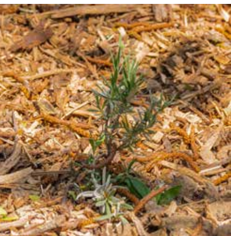
Plantation de lavandes entre la médiathèque Léo-Ferré et la Maison des associations