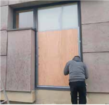
Mise en sécurité d'un carreau de fenêtre à la cantine de l'école maternelle Jean-Jacques-Rousseau