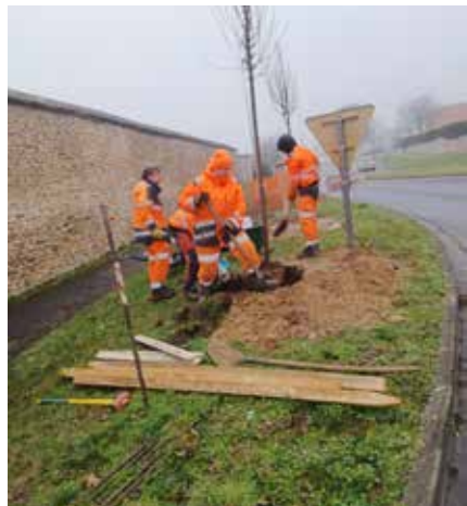
Plantation d'arbres rue de Monthéry