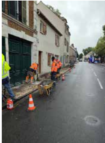
Protection du trottoir croisement rue Alfred-Dubois et rue Mozart