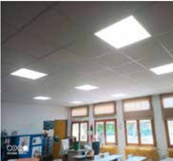
Passage du parc d'éclairage en LED à l'école des Acacias