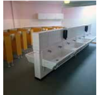
Réfection des sols et des sanitaires à l'école de l'Étang-Neuf