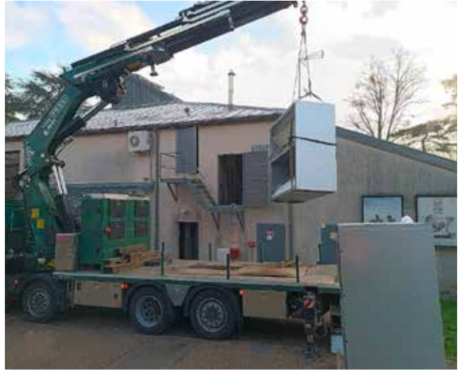
Installation d'une centrale de traitement d'air à Atmosphère espace culturel Jean-Montaru