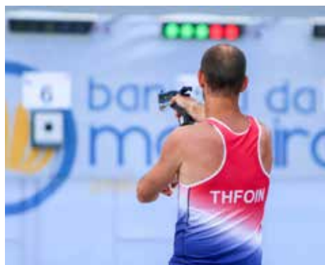
Le tir au laser

Sa détermination est sans faille. Bien que le pentathlon traditionnel implique des épreuves