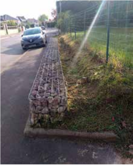
Entretien du talus en gabion route de Briis