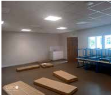
Création et aménagement de la nouvelle classe de l'Orme