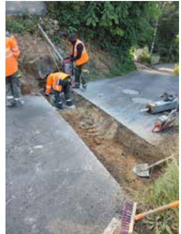
Créations de grilles d'eaux pluviales rues du Mesnil Forget et de la Cassioterie