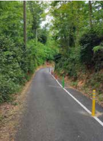
Marquage et balisage du chemin piéton rue du Mesnil-Forget