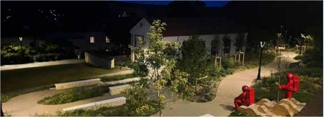
Installation de luminaires LED dans le jardin de la promenade Victor-Hugo