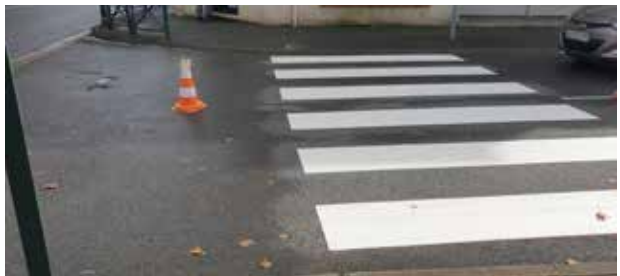
Campagne de marquage au sol dans la commune