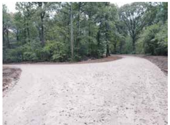
Une nouvelle desserte forestière pour améliorer la gestion sylvicole du massif forestier et faciliter l'accès des pompiers pour lutter contre les incendies en forêt a été créée dans le Bois régional du Déluge. Ces travaux ont été pilotés par Île-de-France Nature, en charge de l'aménagement et de la gestion de l'Espace naturel régional de l'Hurepoix. Une place de retournement a également été créée.