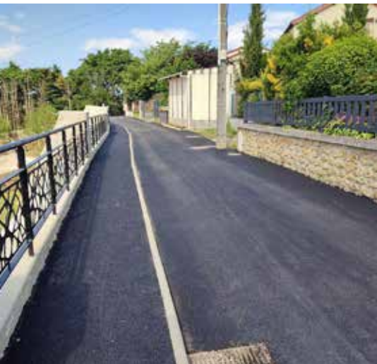
Mise en place de l'enrobé de la chaussée rue des Berges