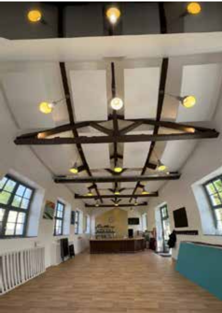
Installation de panneaux acoustiques à la Sirène sur l'École