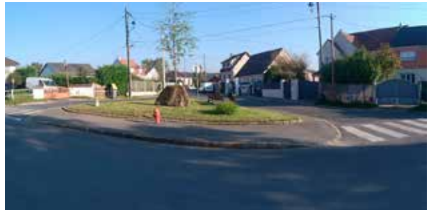
Débroussaillage, taille de haies, ratisage rues des Dahlias, Pasteur, Ruotte, de la Carrière, routes de Briis, de Couard...